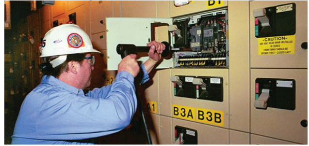
使用HCP2000对模制外壳断路器进行测试